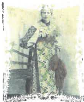
Fig. 7 Costum premiat Astra 1900

La această adunare s-a remarcat expunerea doctorului George Vuia, medic balneolog în stațiune, intitulată „Din trecutul Băilor Herculane”. Printr-o sugestivă descriere istorico-geografică a stațiunii, expunerea acestuia a constituit, de fapt, o excelentă modalitate de promovare, o invitație pentru cei prezenți de a fi oaspeți ai stațiunii.