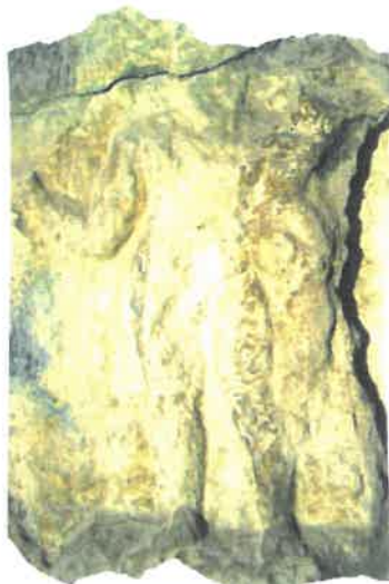
Fig. 4 Basorelieful lui Hercules

Ajunși acolo, cei doi protagoniști ai legendei noastre s-au oprit din nou să-și tragă sufletul și să-și refacă puterile în apa binefăcătoare a izvorului termal. Din nou are loc o luptă pe viață și pe moarte și Hercules îi mai taie un cap balaurului. În cinstea victoriei, oamenii i-au închinat eroului salvator, o sculptură în stâncă muntelui din care curge izvorul, Basorelieful lui Hercules care-l reprezintă pe erou cu buzduganul în mâna stângă și cu o cupă cu apă termominerală în mâna dreaptă (fig. 4).