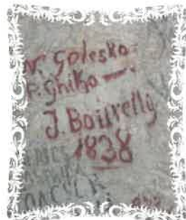
Fig. 3 Semnătura lui N. Golescu

De asemenea, se mai poate distinge, încadrată într-o cunună de lauri, semnătura generalului Traian Doda (1822 – 1895), una din personalitățile de seamă ale Banatului montan. Sub semnătura sa se află înscris anul 1851, când Traian Doda era tânăr ofițer în armata habsburgică 12 (fig. 4).