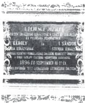
Fig. 12 Placa omagială 1896

Primul rege al României, Carol I, a vizitat stațiunea Băile Herculane, în calitate de oaspete al împăratului Franz Iosef, în anul 1896 atunci când s-a inaugurat Canalul navigabil Porțile de Fier de pe Dunăre. Întâlnirea istorică de la Cazino-ul din Băile Herculane a celor trei suverani, împăratul Franz Iosef, regele României Carol I și regele Serbiei Alexandru I a fost marcată printr-o placă omagială montată în anul 1902 la ieșirea din stațiune (fig. 12).