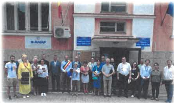
Fig. 14 Foto Herculane - centenar

Simpozionului Național "Herculane – arcade în timp" din iunie 2019 (fig. 14).