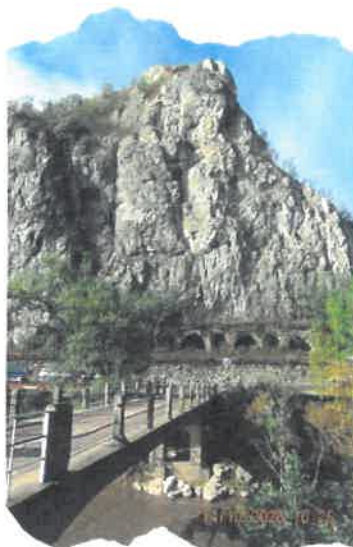
Fig. 6 Piatra lui Iorgovan

Șarpele uriaș, fugărit în continuare de Hercules, se oprește la Topleț , unde are loc o nouă luptă câștigată și de data asta de Hercule. Omagiul adus eroului legendar se materializează printr-o nouă statuie sculptată în stâncă muntelui, Sfinxul bănățean de la Topleț (fig. 5). Tot la Topleț, pe malul Cernei se vede Urma calului lui Iovan Iorgovan . Povestea spune că eroul, după ce a mai tăiat un cap hidrei, ar fi