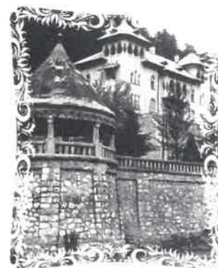
Fig. 10 Vila dr. Crăciunescu și Izvorul de cura internă 1926

În perioada interbelică, în stațiunea Băile Herculane s-au construit noi edificii, dintre care cele mai reprezentative sunt: Hotelul Cerna (1936 – 1939), Vila dr. Crăciunescu (1926) și s-au reabilitat Izvorul de ochi (fig. 9) și Izvorul de stomac (fig. 10) (1926), toate acestea constituind un al treilea nucleu arhitectural al Centrului Istoric. Valoarea deosebită a acestor clădiri constă în faptul că s-a respectat stilul arhitectural neoromânesc specific acelei perioade, demonstrând, fără putință de tăgadă, că administrația românească a fost capabilă să reabiliteze stațiunea Băile Herculane, ba mai mult, să-i sporească zestrea edilitară cu noi edificii balneare și să-i redea stațiunii Băile Herculane faima de altădată pentru a fi vizitată de oaspeți din toate colțurile lumii.