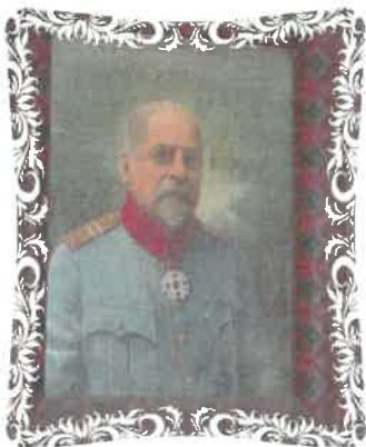
Fig. 11 Tablou cu bustul gen. N. Cena

Din constelația personalităților care și-au legat numele de bimilenara stațiune Băile Herculane se află, la loc de cinste, generalul Nicolae Cena (1844 - 1922) , una din figurile ilustre ale Banatului montan, căruia îi vom aduce un omagiu special anul viitor, în 2022 când vom comemora centenarul trecerii în neființă a generalului (fig. 11). Speranța mea este că se va găsi o modalitate de a se realiza un bust al generalului Nicolae Cena, bust care să fie amplasat, după reabilitarea Vilei Elisabeta, în prima sală a viitorului muzeu al stațiunii Băile Herculane. În afară rolului său meritoriu în procesul de preluare a stațiunii de către administrația românească, generalul Nicolae Cena care a devenit, totodată și cel dintâi primar al stațiunii, a avut un rol esențial în domeniul cultural, prin donarea colecției sale pentru înființarea în anul 1924, a primului muzeu din stațiunile balneare românești, Muzeul de istorie "Gen. Nicolae Cena", muzeu care a fost premiat cu medalia de aur la expoziția din anul 1928 din Parcul Carol, București.