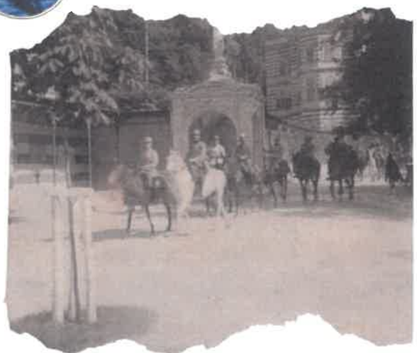
Soldați români intrând în Băile Herculane