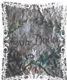
Fig. 4 Semnătura lui T. Doda