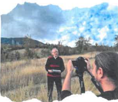
Fig. 1 Sub Geanțul Izvernei

Traseul nostru începe de la Izverna, localitate ce se află la poalele Muntelui PREGLEDA (Preghida, cum spun localnicii) care, potrivit unor autori ar fi Muntele PHELEGRA din vechile teogonii grecești, locul unde s-au luptat Giganții cu Zeii.