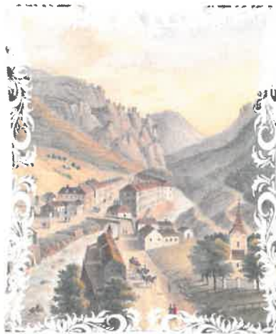
Fig. 1 Herculane la începutul sec. al XIX-lea

Din această perioadă, singurul obiect rămas și păstrat în Muzeul de istoria artei din Viena, este un inel de aur cu gemă, pe care se află gravat un păun și un delfin, descoperit, după cum susțin mai mulți istorici, în anul 1841, cu ocazia construirii zidului împrejmuitoar al bisericii românești (fig. 1). Conform