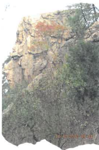
Fig. 5 Sfinxul Bănățean de la Topleț

Izvorul cu apă termosalină poartă numele lui Hercules, iar baia construită de romani, Baia lui Hercules.