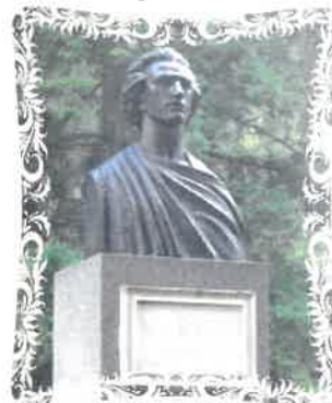
Fig. 6 Bustul lui Mihai Eminescu

Cert este că ne mândrim că astăzi există la Băile Herculane, un bust al marelui poet național și nu unul oarecare, ci opera sculptorului Oscar Han, din anul 1926 (fig. 6).