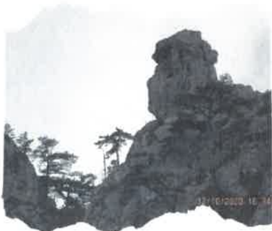
Fig. 3 Sfinxul Cernei

După care hidra a fugit pe Cerna, la vale, cu Hercules în urmărire, până când au ajuns la un alt izvor cu apă termală, acolo unde romanii aveau să întemeieze una dintre cele mai vechi stațiuni balneare ale lumii, pe