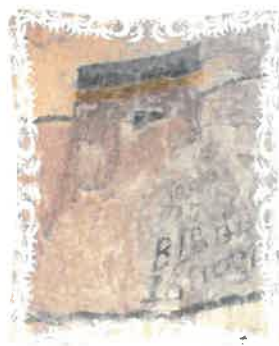
Fig. 5 Tricolorul la 1915

Un element semnificativ care caracterizează „starea de spirit permanentă” despre care vorbea Nicolae Iorga, se observă, la intrarea peșterii și anume steagul tricolor românesc, cu cele trei culori dispuse pe orizontală sub care este înscris anul 1915 (fig. 5). Un gest de curaj patriotic al autorului necunoscut al acestui desen, cu siguranță român, într-o perioadă de război, când zona încă mai era sub administrația maghiară.