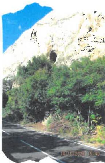
Fig. 7 Peștera Gaura cu Musca

Hercules învinge definitiv monstrul, tăindu-i și ultimul cap, dar, iată că blestemul își face efectul și în acest punct, cele două planuri, legenda și realitatea se împletesc, pentru că, într-adevăr în zona Peșterii Gaura cu Muscă (fig. 7), aflată în